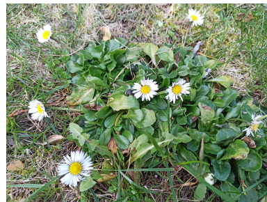
ČEMEŘICE ČERNÁ, SEDMIKRÁSKA CHUDOBKA