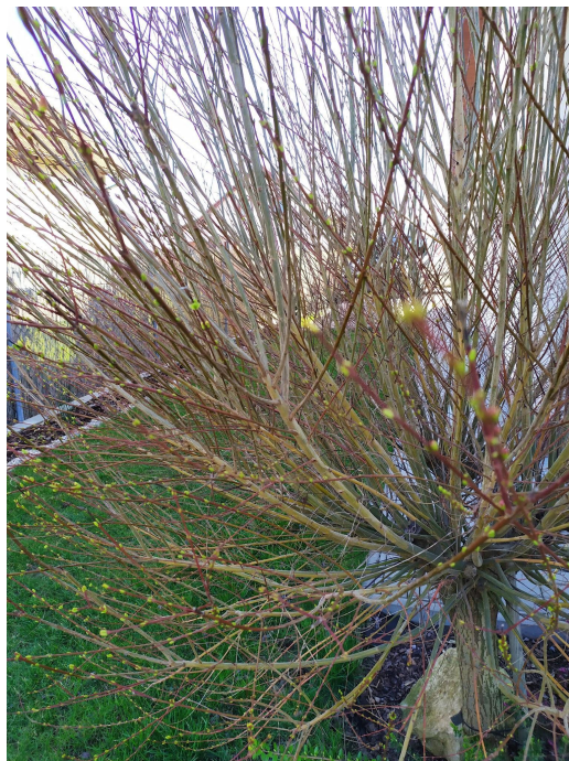
PUČÍCÍ VRBA JAPONSKÁ

OKRASNÝ A OPADAVÝ KEŘ, ATRAKTIVNÍ LISTY MAJÍ ZELENO-BÍLO-RŮŽOVOU BARVU.