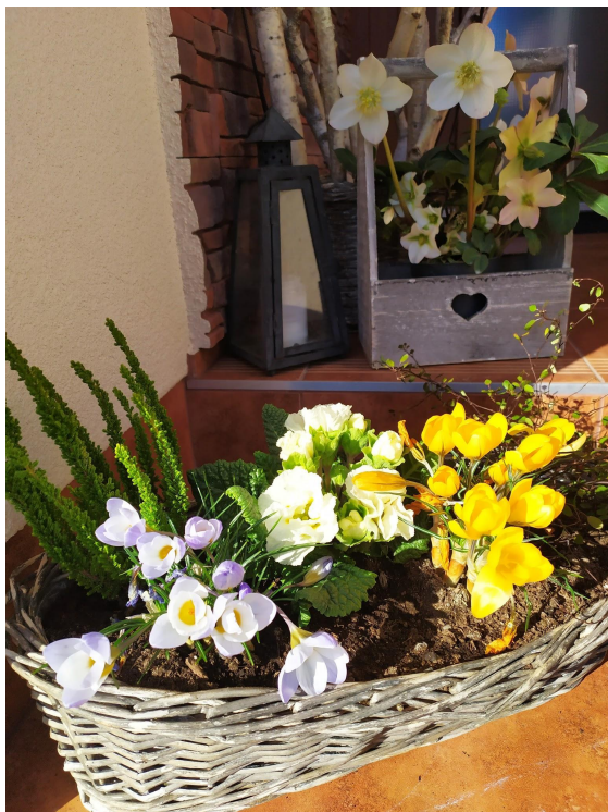
JARNÍ VÝZDOBA U VCHODU NAŠEHO DOMU